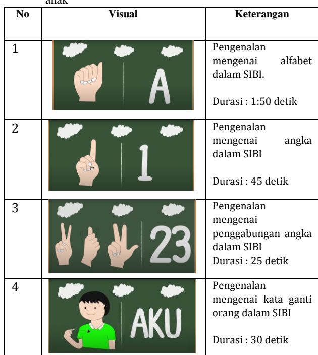
Tabel 1. Storyboard video edukasi 2D mengenai SIBI pada anak-anak